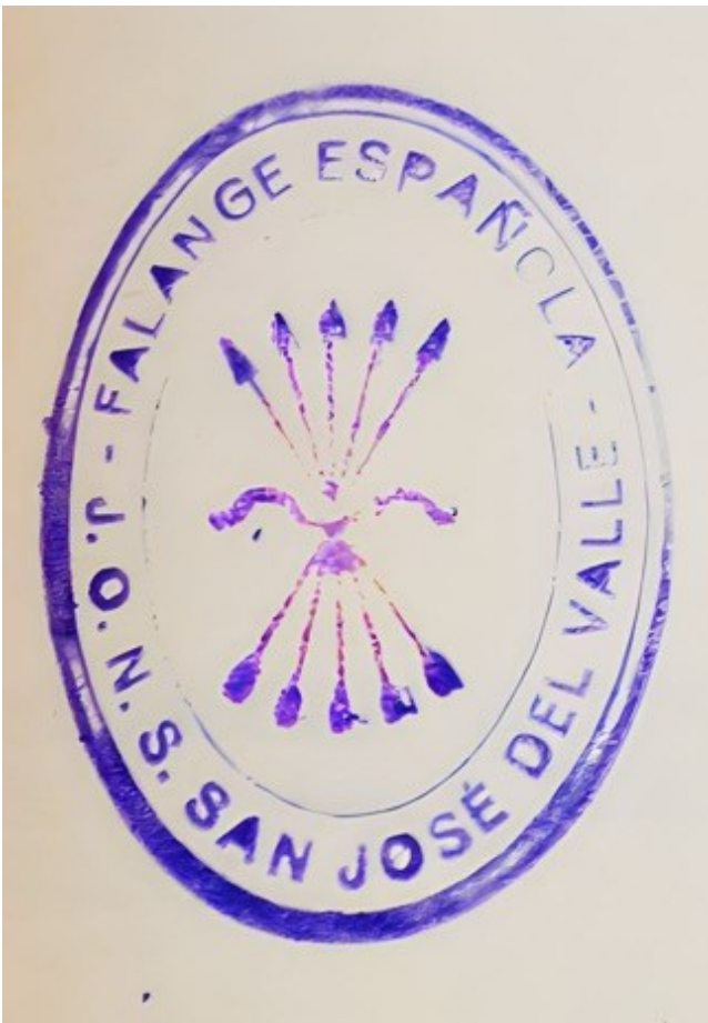
Sello de Falange Española de las JONS de San José del Valle