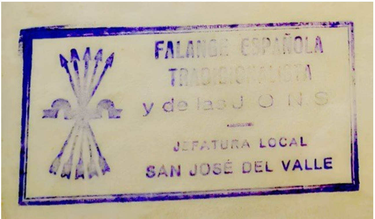
Sello de Falange Española y Tradicionalista de las JONS de San José del Valle